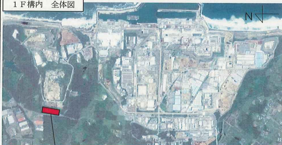
1 F 構内 全体図